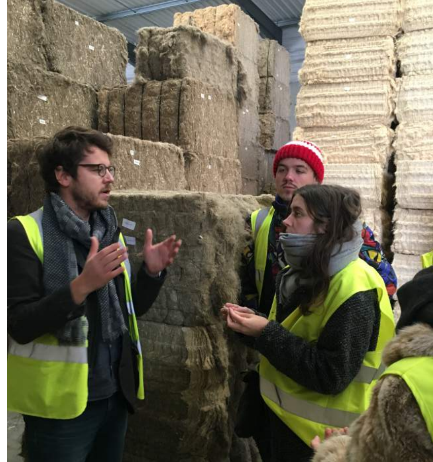
Visite de La Chanvrière Workshop entre écoles

Partenaires : Laboratoire R&D Fibre Recherche et Développement - FRD, la coopérative agricole La Chanvrière, Interchanvre, et les entreprises Emanuel Lang et la Corderie Meyer-Sansboeuf.